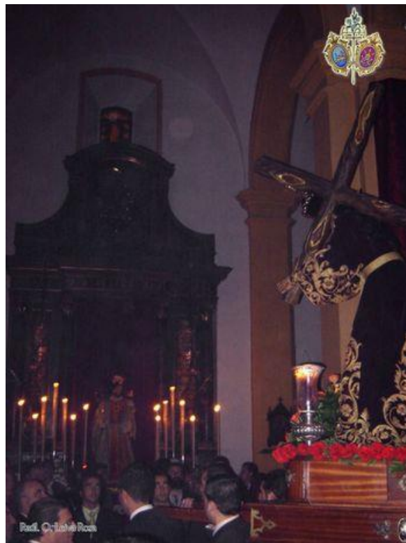
Patrón y Regidor cara a cara. Dos devociones históricas de la Isla. 19-3-2006

Por eso no es de extrañar que el paso procesional del Regidor Perpetuo de nuestra ciudad cuente con una alusión claramente josefina en su canasto.