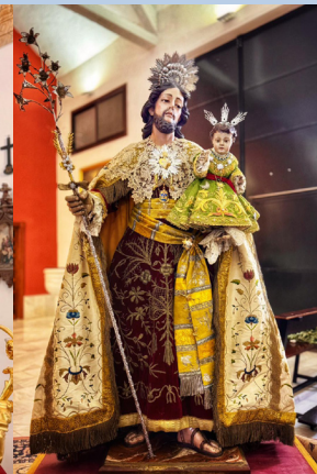
Procesión extraordinaria y Corpus Christi 2025