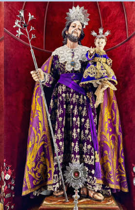
Cultos fieles difuntos 2025