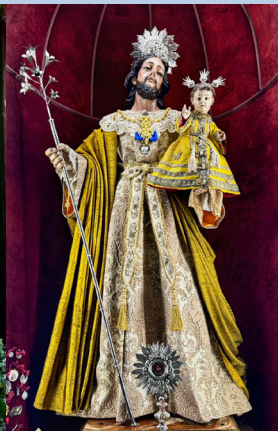
Pascua Mayo-Junio 2025