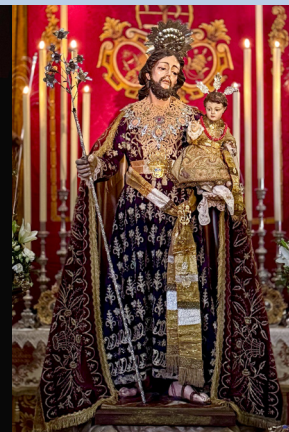
19 de Marzo 2026