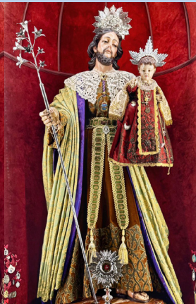
Cultos Santa Teresa 2025