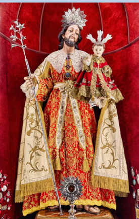
Adviento de Navidad 2025