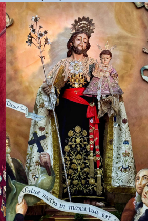
Cultos del Voto 2025