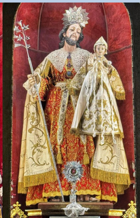
Pascua de Navidad 2026