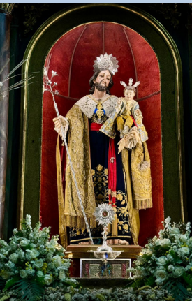
1 de Mayo 2025