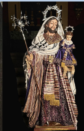
Cultos Siete Domingos 2026