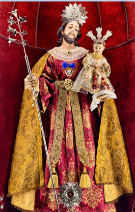
Tiempo ordinario Julio 2025