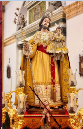
Bendición del mar 2025